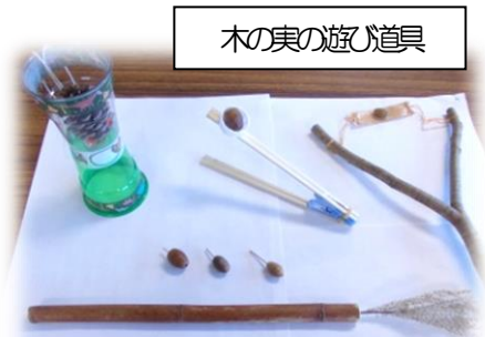
木の実の遊び道具