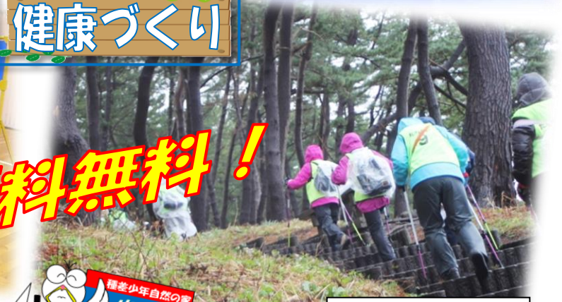
ハルディックウォーク